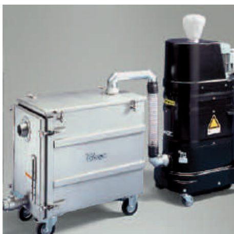
NA 250 inox sans filtre à poussière résiduelle avec aspirateur industriel type DS 1220