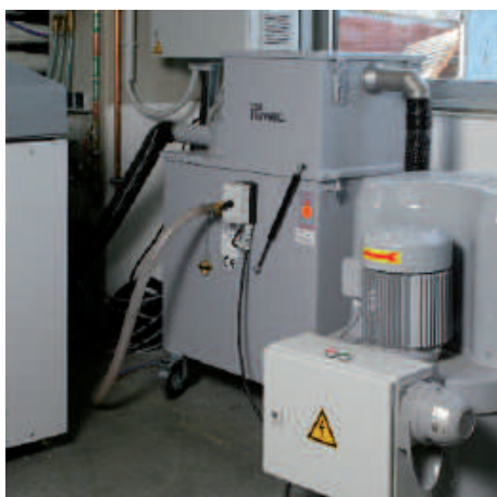
NA 250 tôle sans filtre à poussière résiduelle avec groupe d'aspiration dans la transformation des plastiques