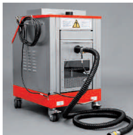
NA 7-11 avec accessoires