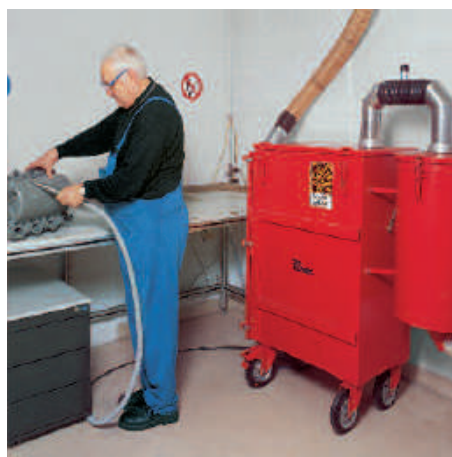
NA 250 tôle avec filtre à pou- ssière résiduelle dans la production chez les équipementiers automobiles