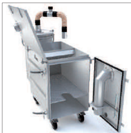
NA 250 inox avec filtre à poussière résiduelle