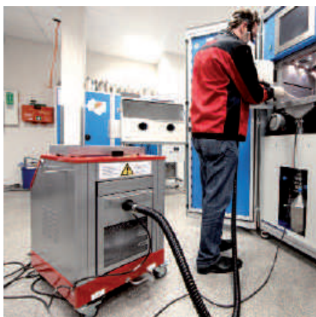
Utilisation dans la production SLM