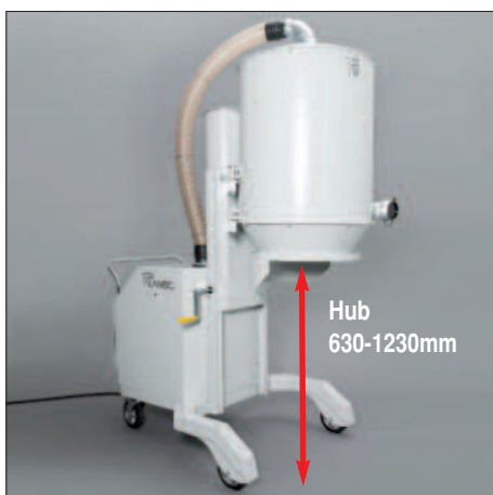
Unité de séparation réglable