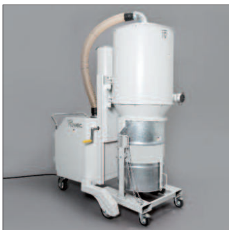
Conteneur de 200 litres avec dispositif de basculement et sacs à gerbeur