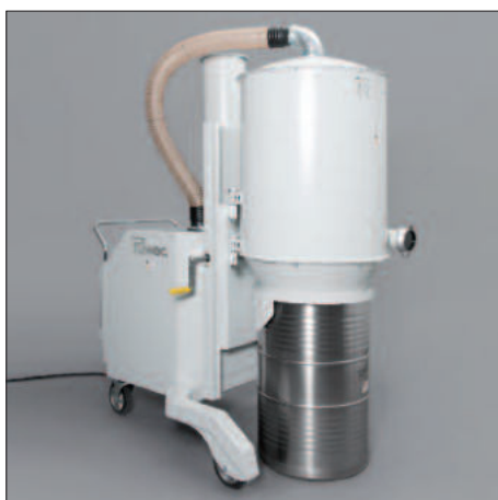
Conteneur de 200 litres