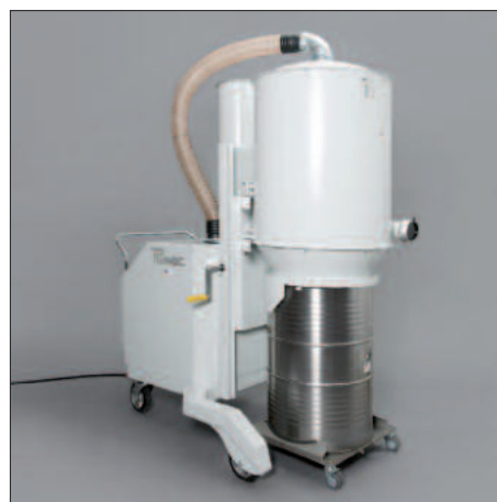
Conteneur de 200 litres avec chariot