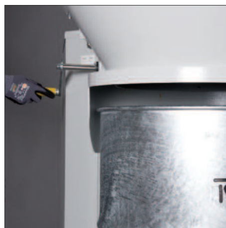
Adaptation exacte à l'unité de séparation utilisée