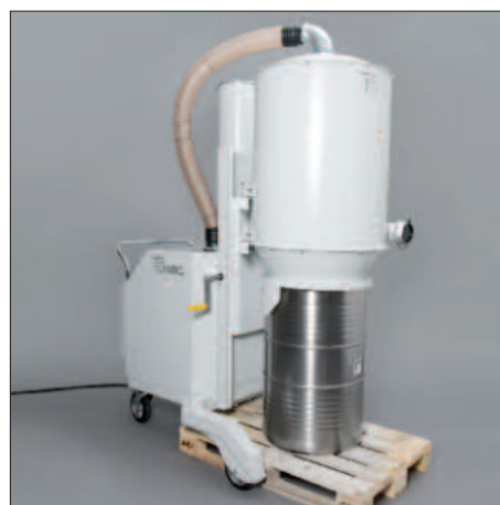
Conteneur de 200 litres sur palette Euro