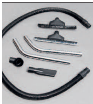
pour WS 100