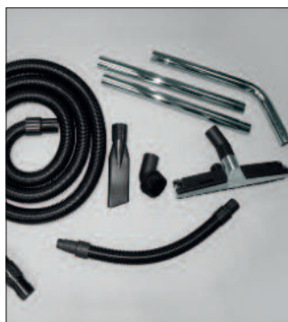
pour WS 200