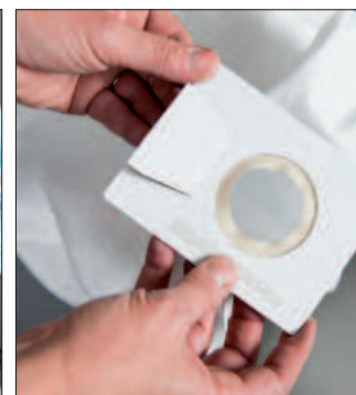
Sachet du filtre