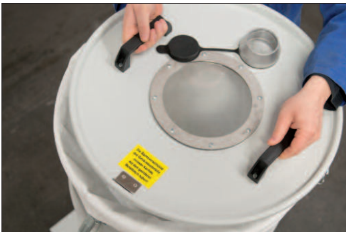
Remplacement du filtre par simple levage du couvercle