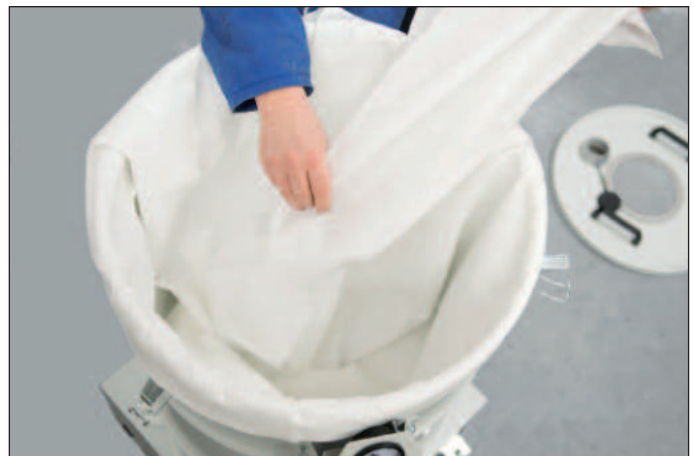
Installation très simple et rapide