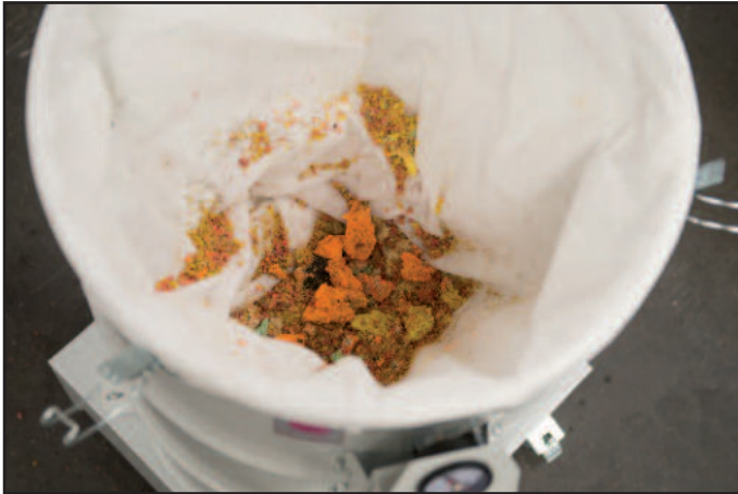
Collecte des résidus de coupe dans un sac non tissé

Les aspirateurs industriels de la série DAV-SB sont utilisés sur des installations de production pour l'aspiration de peluches et résidus de découpe (papier, plastique, tissu). Leur puissance d'aspiration, leur construction et leurs dimensions sont adaptées aux exigences des machines de production pour lesquelles ils sont utilisés. Les résidus de coupe sont aspirés et collectés dans un sac filtrant de classe de poussière M. Les matériaux aspirés sont automatiquement compactés de façon à exploiter au maximum le volume du filtre. Une fois plein, le sac filtrant se retire facilement de l'aspirateur.