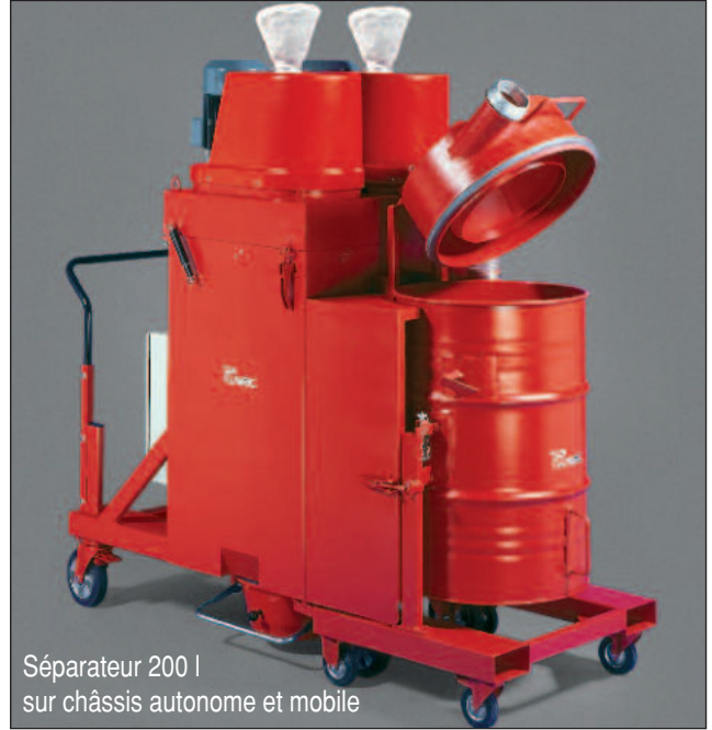
Séparateur 200 l sur châssis autonome et mobile